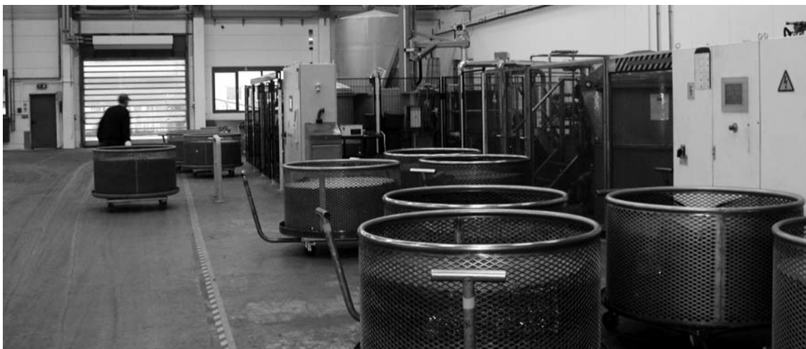
In diesen Körben werden die Motorenteile in das Imprägnierungsbad gehängt

Zum Jahresende 2012 zog die Firma Henkel Loctite- KID von Garching in die leer stehenden Hallen im kleinen Gewerbegebiet in Untermarchenbach. Die GmbH, die zu 100 Prozent zum Henkel-Konzern in Düsseldorf gehört, imprägniert an acht Standorten in Deutschland Metallbauteile im Vacuumimprägnationsverfahren. Für die Übernahme einer fast neun Meter hohen Imprägnieranlage suchte das Unternehmen eine rund zehn Meter hohe neue Produktionsstätte. In Untermarchenbach wurde das Unternehmen, schließlich fündig.