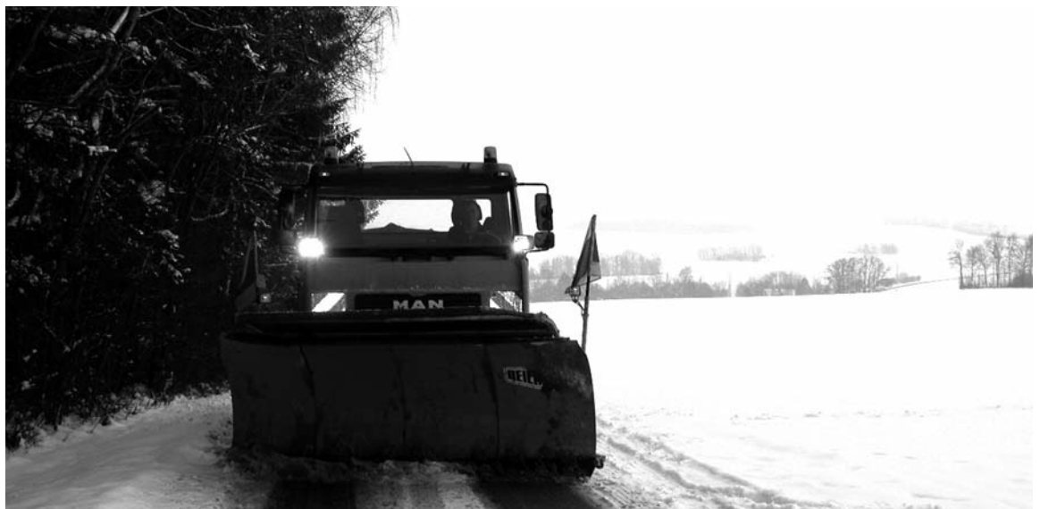
Wenn es schneit sind die Gemeindearbeiter beinahe rund um die Uhr unterwegs und sorgen für sichere Straßen.

Die Mitglieder des Haager Kulturvereins treffen sich am Mittwoch, 6. Februar zur Neuwahl ihrer Vorstandschaft um 20 Uhr im Cafe Ampertal. Alle Interessierten sind willkommen.