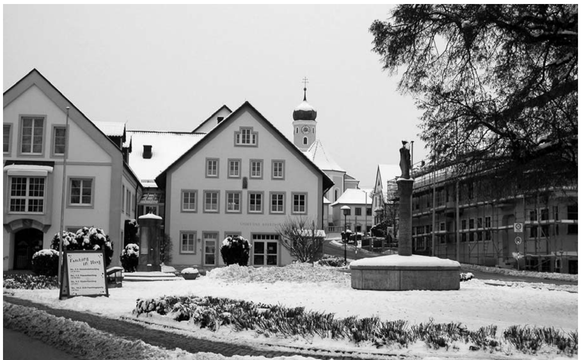
Winteridylle am Haager Dorfplatz. Das Plakat weist auf die Faschingsveranstaltungen in der Gemeinde hin.

Die Inkofener Feuerwehrmänner erhalten für 6.000 Euro zehn neue Komplettausrüstungen aus Hosen, Helm, Nackenschutz, Jacken und Handschuhen. Die Feuerwehr konnte fünf neue aktive Feuerwehrmänner gewinnen und fünf Anzüge werden ersetzt.