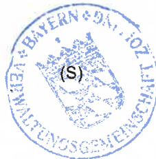
(Anton Geier) Erster Bürgermeister